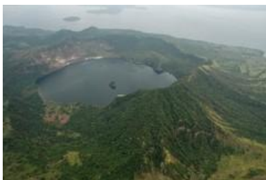
■ Taal lake and volcano, Batangas City

火山の噴火口が湖となりその中からまた噴火による島が誕生、さらにその島の中で湖が誕生。