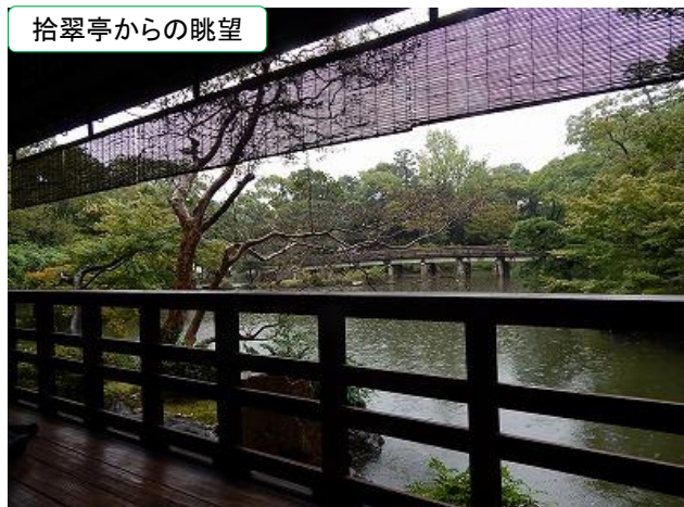
拾翠亭からの眺望