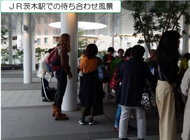
JR茨木駅での待ち合わせ風景